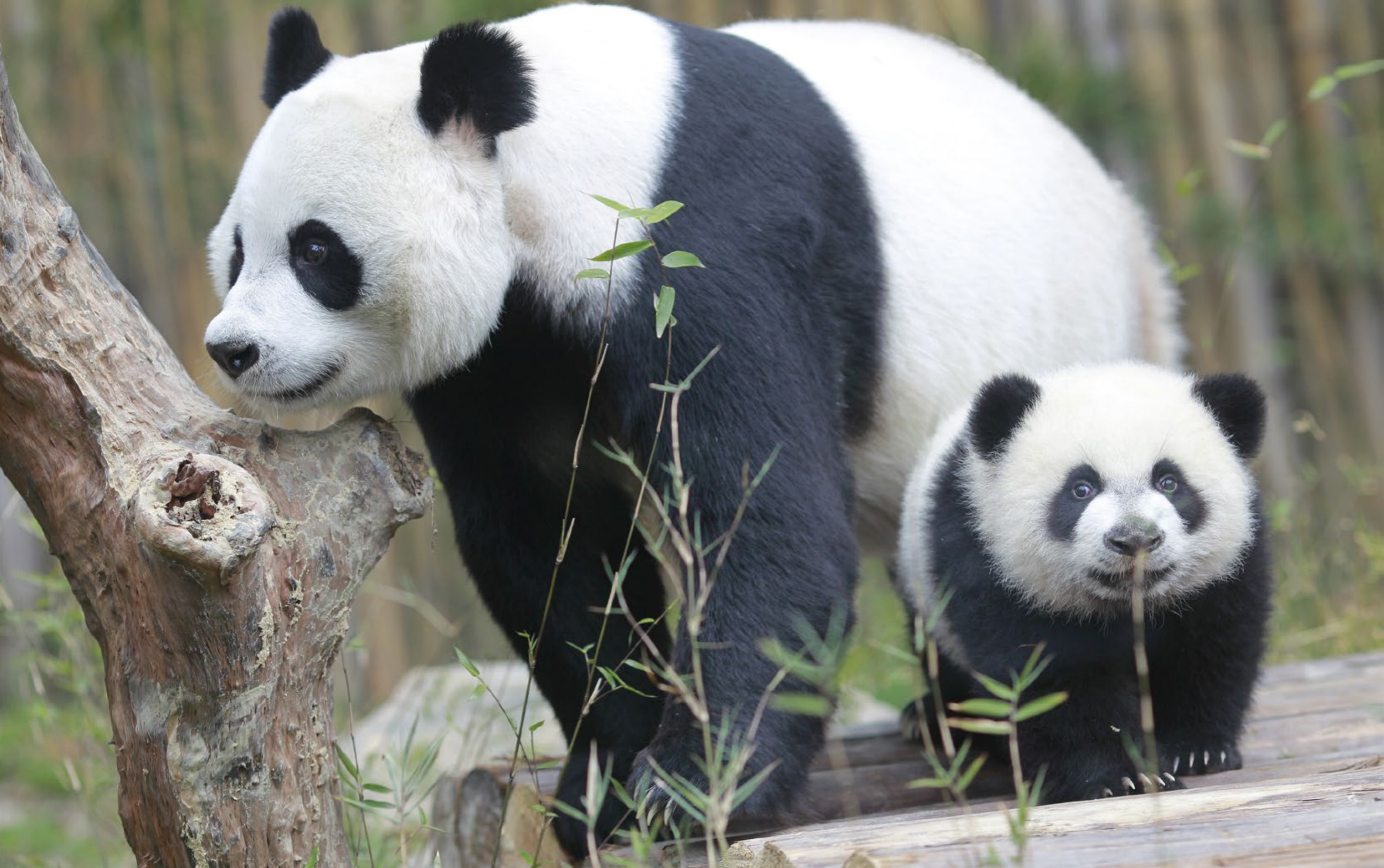
liǎng zhī dà xióng māo 两只大熊猫